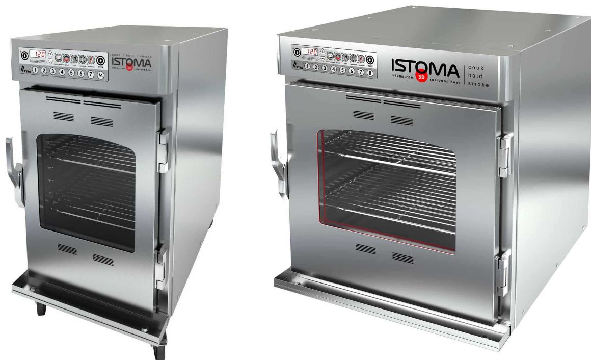
Рис 1. Общий вид печи ISTOMA-EM (слева модель LTO-100EMS, справа модель LTO-190EMS)

Печь низкотемпературная ISTOMA-EM предназначена для тепловой обработки и/или копчения, а также последующего сохранения приготовленного продукта при заданной температуре. Основное отличие низкотемпературных печей от прочих заключается в способе подведения тепла в рабочую камеру. Здесь нет иссушающей конвекции, нет жесткого теплового излучения ТЭНов.