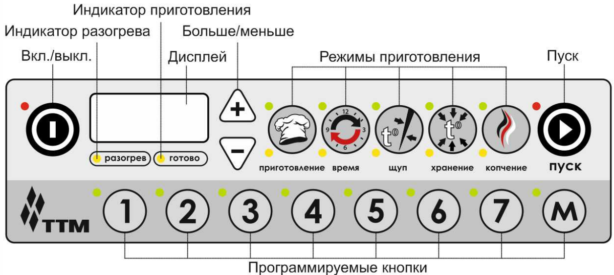
Рис. 3. Панель управления печи ISTOMA-EM

При достижении установленных параметров печь автоматически переходит из режима приготовления в режим хранения. Во время приготовления с использованием датчика-щупа печь автоматически перейдет в режим хранения при достижении заданной температуры внутри продукта.